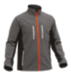
SOFTSHELL FORTE 349-POX-23 PÁG.59