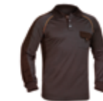
POLO FORTE MANGA LARGA 463-POL-17 PÁG.58