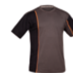
CAMISETA FORTE MANGA CORTA 477-COT-16 PÁG.58