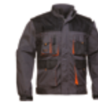
CAZADORA FORTE 319-TER-26 PÁG.56