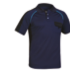
POLO FORTE MANGA CORTA 461-POL-17 PÁG.58