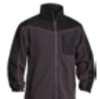
FORRO POLAR FORTE 347-POL-30 PÁG.59

Un conjunto de prendas diseñadas para afrontar las tareas más exigentes de manera resistente y atractiva al mismo tiempo.