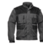
CAZADORA FORTE 319-COX-28 PÁG.53